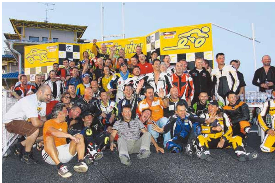
Ein bunter Haufen feierte den Saisonschluss am Pannoniaring.

Für 2010 wird das Reglement etwas gestrafft und damit werden die Nenngelder für die Fahrer deutlich gesenkt. Wir hoffen damit noch mehr Teilnehmer, insbesondere auch mehr Schweizer Fahrer für diese attraktive Rennserie gewinnen zu können. ■