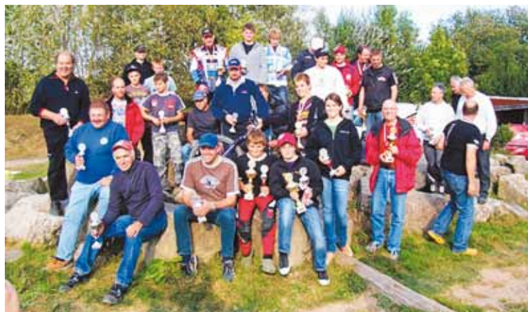
Alle Pokalgewinner auf einen Blick.