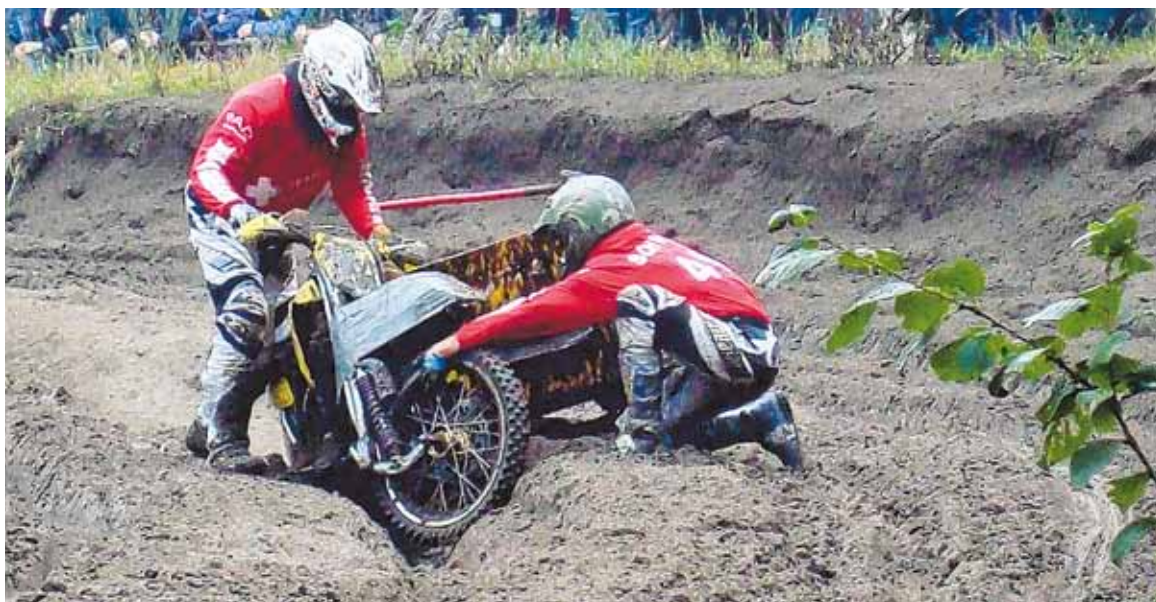
Ein symbolisches Bild für die Schweizer in Heeswijk – die Umstände waren sehr schwierig, und irgendwie liefs einfach nicht rund ...

Auf dem Weg nach Holland war der Treffpunkt für die Schweizer Teams das «Kart-Center Michael Schumacher» in Kerpen. Von den fünf angereisten Teams fuhren 18 Personen mit einem Kart in zwei Gruppen aufgeteilt. Nicht wie üblich im Freien, sondern in der Halle musste gefahren werden, da es regnete. Der Kampfgeist war schon erwacht und es wurde gestossen, gerempelt, überholt unter lautstarkem Anfeuern der mitgereisten Teammitglieder.