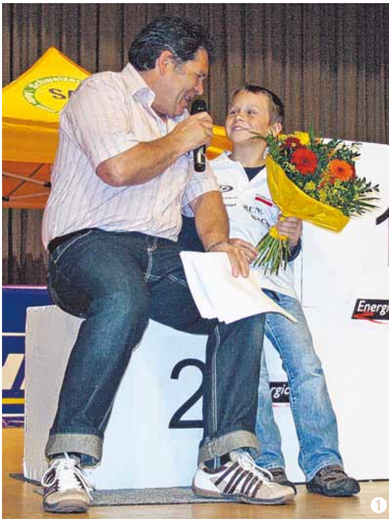
1. Keiner zu klein, ein Interview zu geben ...