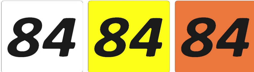
Bild 2 / Farblayout Start-Nr nach Kategorie von links nach rechts M0, M1, M2

Die Haupt Nummerntafel muss vorne zwischen dem Lenker angebracht werden. Diese müssen aus 10 Meter Entfernung problemlos lesbar sein. Seitliche Nummerntafel sind erlaubt jedoch nicht vorgeschrieben.