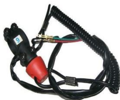
Fig. 1: Kill Switch