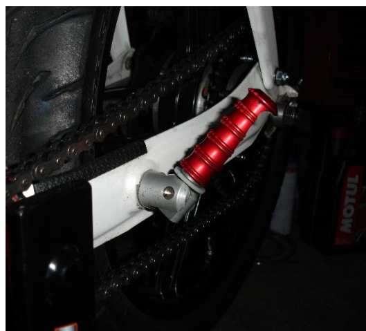
Fig. 5: Klappbare Fußraster