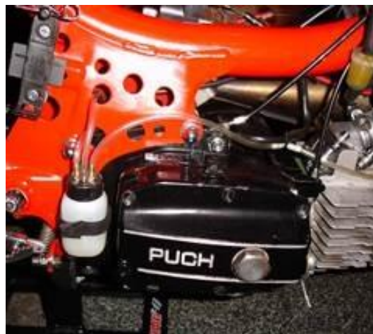
Fig. 4: Überlaufgefäß