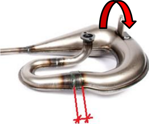
Fig. 7: Proma (Technigas) Circuit für Rookie Cup