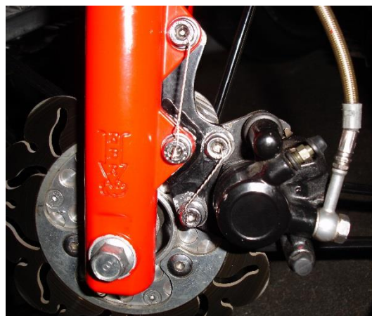
Fig. 6: Gesicherte Bremszange