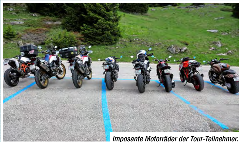
Imposante Motorräder der Tour-Teilnehmer.