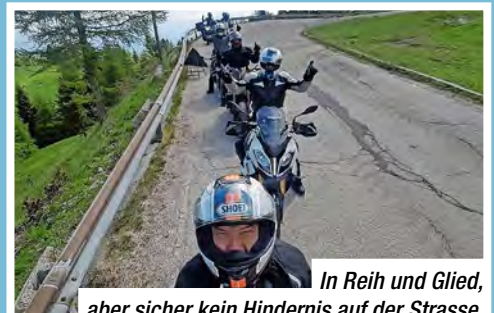
In Reih und Glied, aber sicher kein Hindernis auf der Strasse.