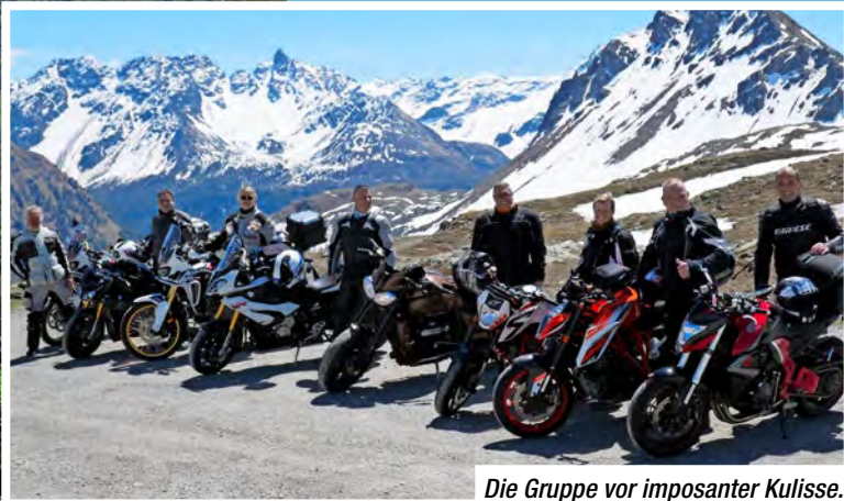
Die Gruppe vor imposanter Kulisse.