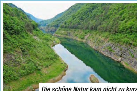
Die schöne Natur kam nicht zu kurz.