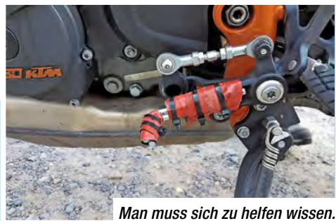
Man muss sich zu helfen wissen.