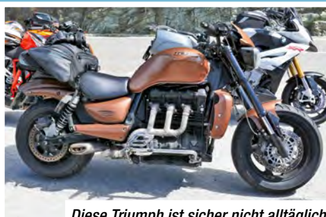
Diese Triumph ist sicher nicht alltäglich.