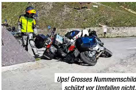
Ups! Grosses Nummernschild schützt vor Umfallen nicht.