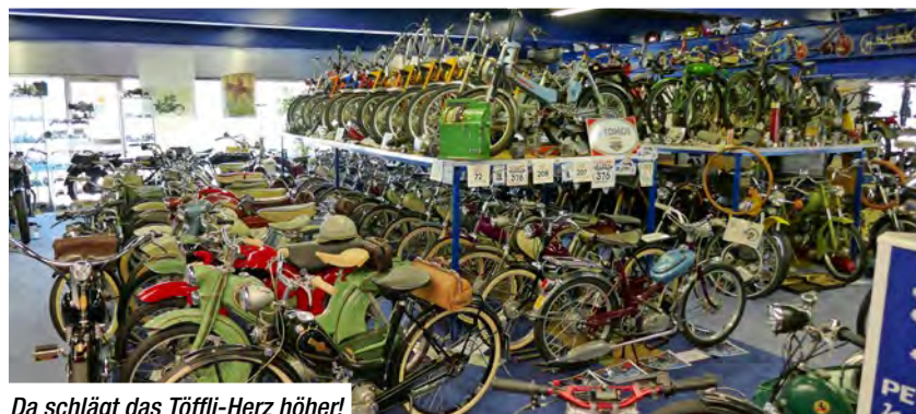
Da schlägt das Töffli-Herz höher!

Sachs angestellt haben :-)) ... einige Kolbenfenster und «Frisierkünste» sind ausgestellt und zu bewundern. Aber auch eine absolute