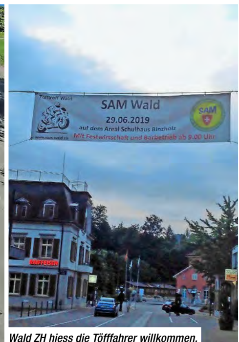
Wald ZH hiess die Töfffahrer willkommen.