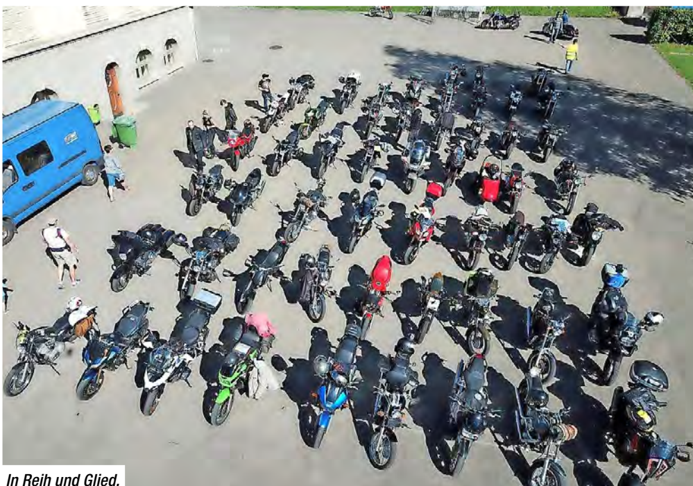
In Reih und Glied.