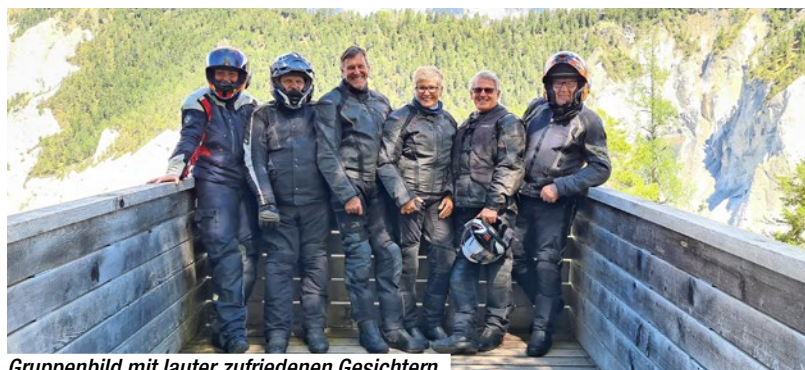
Gruppenbild mit lauter zufriedenen Gesichtern.