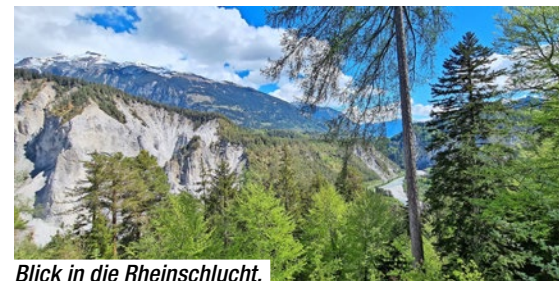
Blick in die Rheinschlucht.

Danke an Ruedi und unsere Partner und Unterstützer der Tourismussparte 3W Motosport, Motos Knüsel GmbH, Backyard Racing Strasse, Honda Moto und KTM Schweiz. Ja und alle Infos über unser Programm findet ihr unter www.s-a-m.ch/Termine/Tourismus