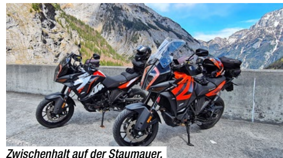
Zwischenhalt auf der Staumauer.